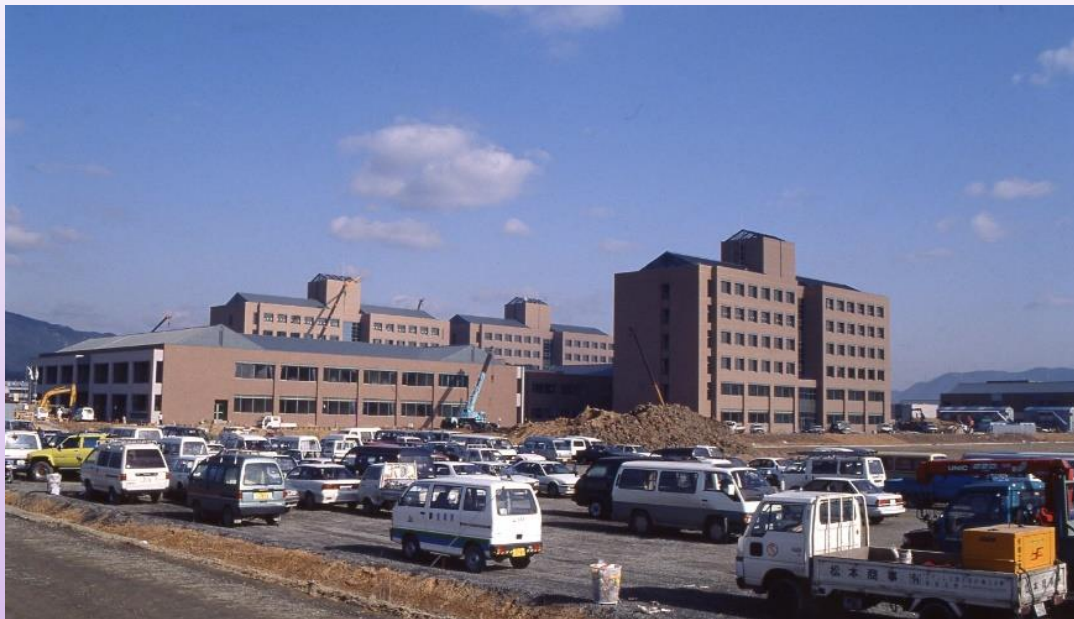
建設工事 平成5年(1993)2月10日