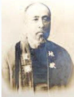
中川横太郎肖像 (当館蔵)

中川横太郎という傑物 けつぶつ がいた。知る人ぞ知るである。今回は横太郎とその周りの人々を取り上げ、明治の岡山人の生き様を学んでみましょう。