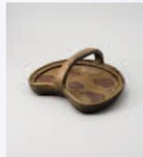
備前焼手鉢 (岡山県立博物館蔵)

備前焼の実物を見ながら、その作られた時代の見分け方や、鑑賞のポイントなどを紹介します。一緒に実物を手に取って、観察してみましょう。