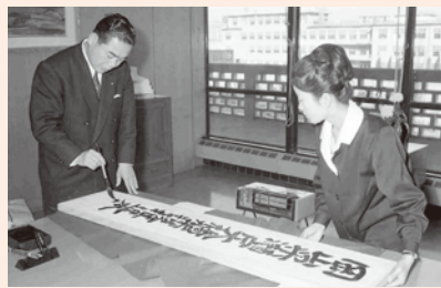
加藤武徳知事 岡山県瀬戸大橋架設推進本部看板の揮毫(昭和41年1月)