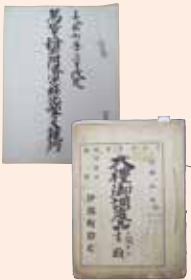
(上)「馬屋上村共同済世社安部会 支社規約」(大正7年3月)