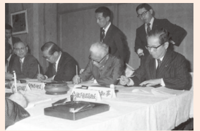
長野士郎知事 重度障害者多数雇用事業所(吉備松下) 設立協定書の調印式(昭和55年9月)