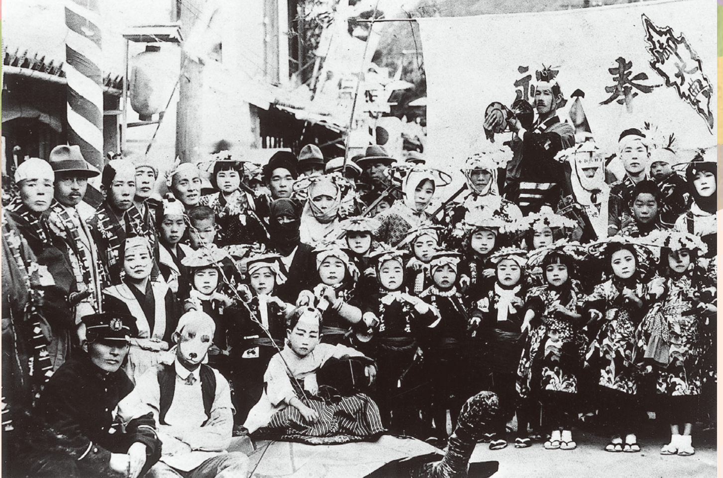
御津郡金川町(岡山市北区)御大典奉祝の写真(昭和3年11月)