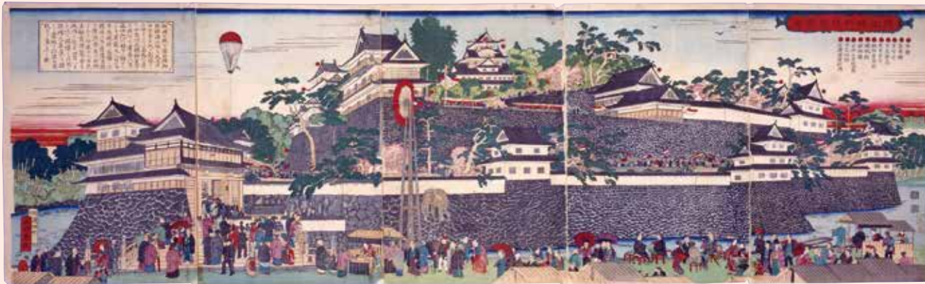
岡山城内博覧会図(明治12年)

また、現在へつながる岡山のターニングポイントとして、明治・大正・昭和における岡山県政の転換点をクローズアップします。