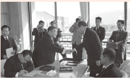
三木行治知事 三菱石油工場誘致協定書の調印式(昭和33年2月)